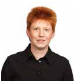
Petra Pau Marzahn-Hellersdorf Henny-Porten-Straße 10-12 12627 Berlin Tel.: 030/99289380 petra.pau@bundestag.de