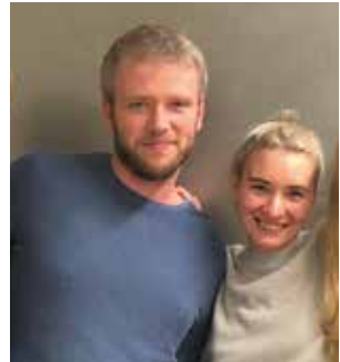
Philine (27) und Stefan (30) sind beide im Bezirksverband Mitte organisiert und arbeiten in der Arbeitsgruppe Mitgliederarbeit beim Landesvorstand mit. Dort gestalten sie mit anderen gemeinsam die Mitmach-Angebote der LINKEN in Berlin.