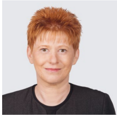
Petra Pau ist Ur-Berlinerin, Vizepräsidentin des Bundestages, Mitglied des Innenausschusses und arbeitet für Bürgerrechte und gegen Rechtsextremismus

Berlin wählt am 11. Februar 2024 erneut. Unsere Stadt ist die östlichste aller westlichen Großstädte. Die Kriege in der Ukraine und im Nahen Osten finden gewissermaßen vor unserer Haustür statt. DIE LINKE will Frieden, nicht Kriege bis zum bitteren Ende.