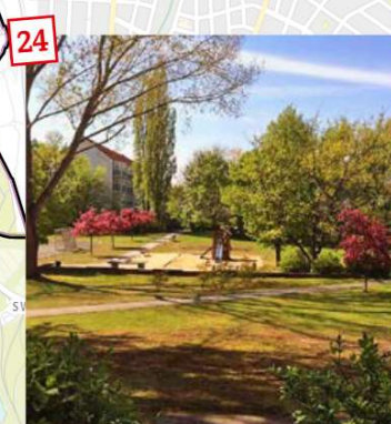
Wir wollen die Ilsehöfe von Bebauung freihalten. Ein entsprechender B-Plan zur Sicherung muss nun zügig vorangetrieben werden.