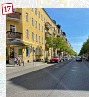
Milieuschutzgebiet auch für das Gebiet Frankfurter Allee Nord! Auf Initiative der LINKEN wurde ein Milieuschutzgebiet in der Weitlingstraße eingerichtet.